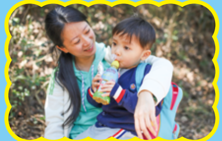
媽媽：「今日你好堅持行畢全程，抵錫」 小王子：「不如快快去參加遊戲啦，好心急呀！」