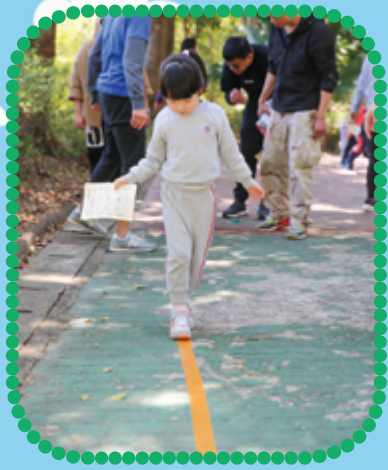
我行山一小時， 仍然可以直線步行

在老師及工作團隊帶動下，大家十分投入，心中也熱血沸騰，活動絕無冷場。最後，眾位老師進行「救救地縛貓大行動」，分別飾演「綠悠悠巨人」、「堅強拯救隊隊長」、「正直拯救隊隊長」、「活潑拯救隊隊長」和「地縛貓」帶領親子活動，最後與園生及家長都身體力行，一起進行環境整理，培育小王子、小公主把潔淨的環境交還給大自然，感恩大自然陪伴大家度過美好的一天。