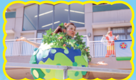
「我今日最有型有款」(設計對白)