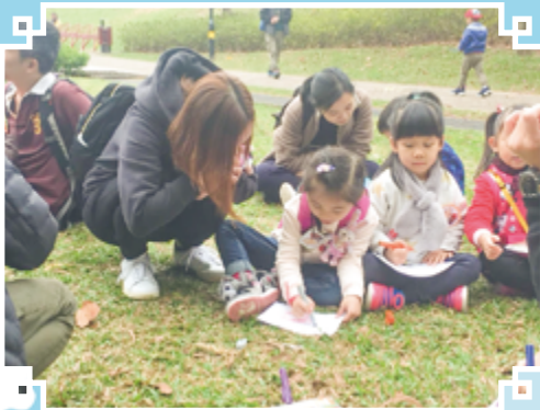
齊來記錄觀鳥過程