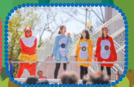
老師也傾盡全力表演