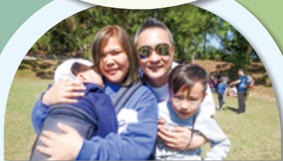
幼高班第三組戈紹丞家長 非常開心、充實！可以放下繁忙的工作接觸大自然！