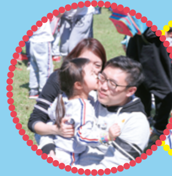
爸爸媽媽，我錫晒你！