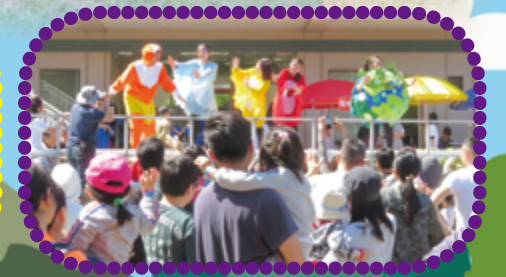
「跟住做，無難度」 「爸爸，你專心D啦!!」